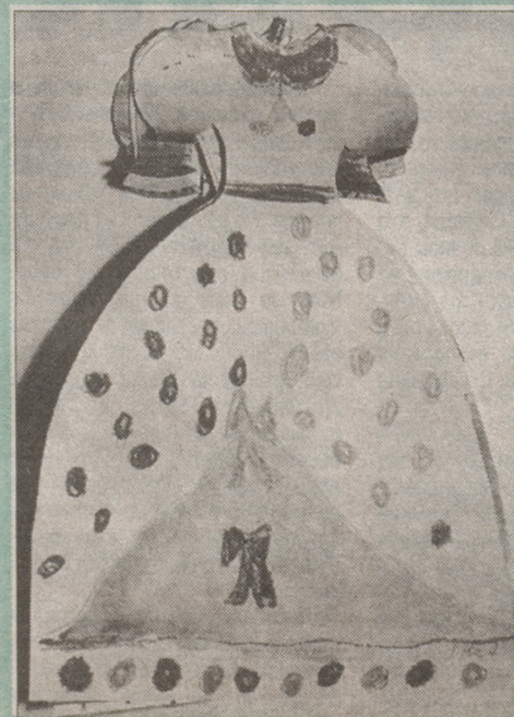
«Гардероб Снежной Королевы» Коллективная работа детей подготовительной группы