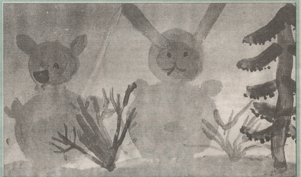
Аня Бобрикова, 5 лет. «Зверята-снегурята»