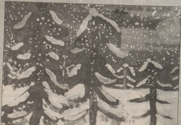
Илья Михель, 7 лет. "Снег идет".

Жители дома №2 по ул.Киргетова получили в канун Нового года подарок от городских властей: 28 декабря им подключили газ. Теперь вместо неудобных газовых баллонов в доме - 16 новеньких четырехконфорочных газовых плит.